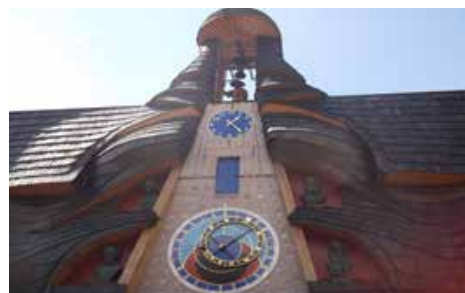
Orloj v Starej Bystrici

Tak čo vy na to? Za seba môžem povedať, že sa páčilo všetko. Ak by sme sa teda niekedy na týchto miestach stretli, určite to nebude náhoda.