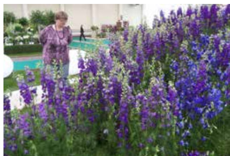
Kvet Flóry 2017

Začiatkom mája za členovia ODOS, ktorí majú záujem o pestovanie a aranžovanie kvetín, zúčastnili medzinárodnej výstavy Flóra v priestoroch výstavniska Incheba v Bratislave. Mňa tento rok osobne prekvapil Kvet flóry – Delphinium hybridum, pripomínal mi šľachtenu strachu nôžku, ktorú som poznala v nešľachtenej forme zo záhrady mojej mamy.