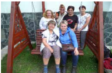
Zaslúžený relax účastníkov pobytu

Koncom júna kancelária ODOS pripravovala Rekondičný pobyt združení ODOS, ktorý plánovala realizovať vo Vile Paula v Novom Smokovci vo Vysokých Tatrách v termíne od 10. – 16. júla 2017.