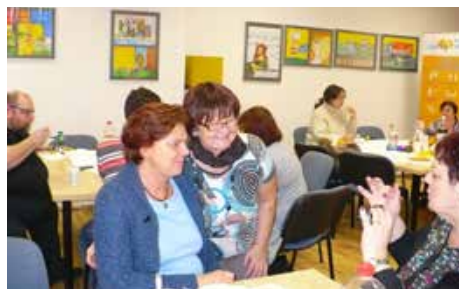
Stretnutie na kapustnici

mení stretnutí a rozhovorov o vy-darených podujatiach, ale aj o problémoch, s ktorými sa združenia v priebehu minulého roka stretli. Možnosť vzájomnej výmeny skúseností z fungovania organizácií v regiónoch, ich práce s klientmi, ale rovnako tak zdieľanie radostí z osobného života, sú na takýchto podujatiach vzácné a jedinečné.