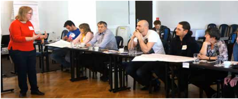
Účastníci vzdelávania EPF

Kurz prvej pomoci. Pozostával z konkrétnych praktických ukážok. Lektorka nás rozdelila do skupín, v ktorých sa stretli ľudia z občianskych združení, ktoré sa venujú pacientom s rôznymi ochoreniami. Inštruktori prvej pomoci vytvorili stanovišťa, ktorými postupne prechádzali všetky skupiny účastníkov školenia. Najprv nám stručne vysvetlili, o akú pomoc ide a v akých situáciách ju môžeme aplikovať. Potom nasledovala ukážka inštruktora a potom si niekoľkí členovia skupiny prakticky vyskúšali to, čo ukázal inštruktor.