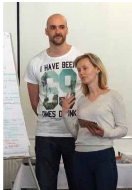
Prezentácia projektu združenia Lymfoma Slovensko

V rámci prezentácie predstavili svoju kampaň lídri OZ ŠŤASTIE SI TY. Vychádzali sme z toho, že v okrese Prievidza, ako aj v celom regióne Horná Nitra, nie je Rehabilitačné stredisko, ktoré by bolo