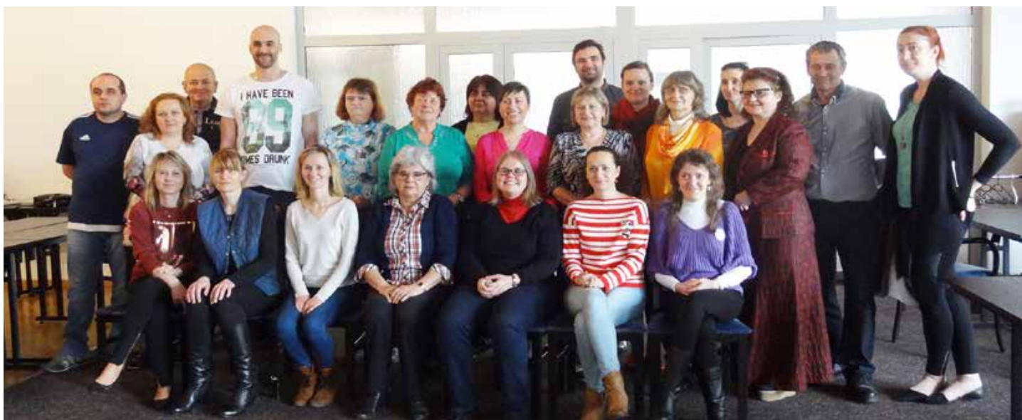
Spoločná fotografia účastníkov vzdelávania EPF v Piešťanoch