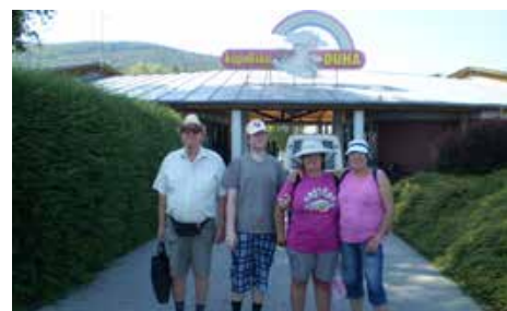
Výlet členov združenia Prvosienka na kúpalisku Dúha v Partizánskom

V horúcich letných dňoch členovia OZ Prvosienka navštívili kú-