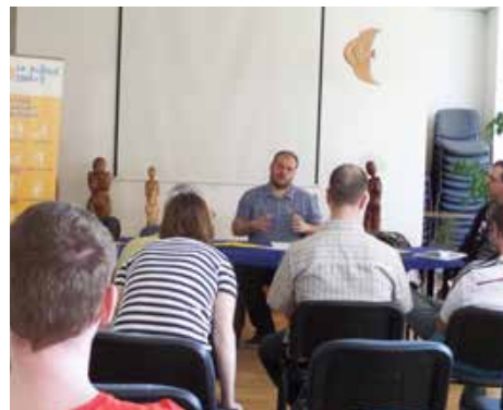
Valné zhromaždenie združenia SOFIA

da združenia, nás sprevádzal pomocou obrázkov históriou združenia. Stretnutie bolo spojené aj s Valným zhromaždením Sofie.