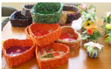
Výrobky členov združenia Prvosienka