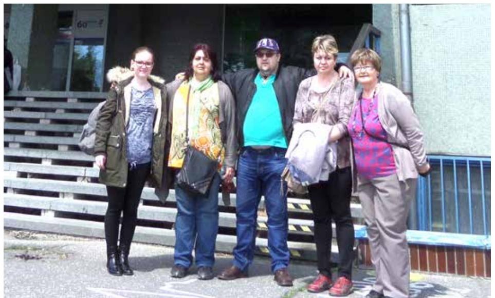
Účastníci vzdelávania kurzu SZU - Pacient a liek v Bratislave