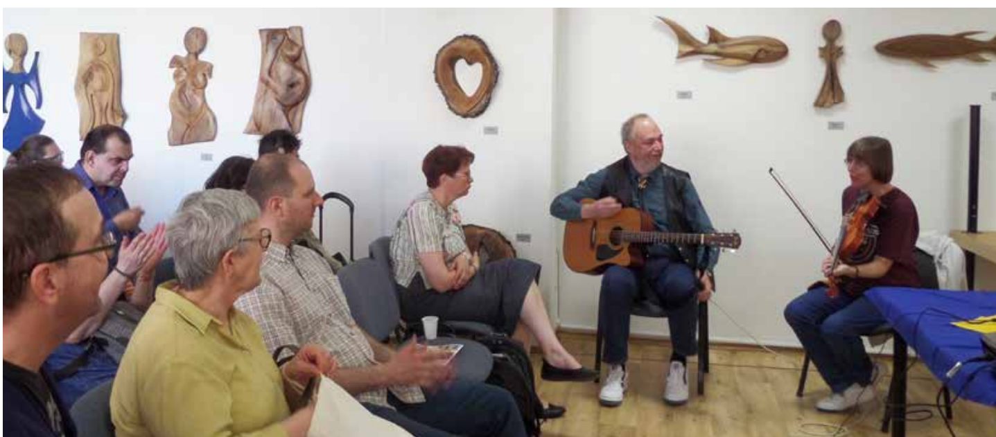
Oslava výročia a Valné zhromaždenie združenia SOFIA