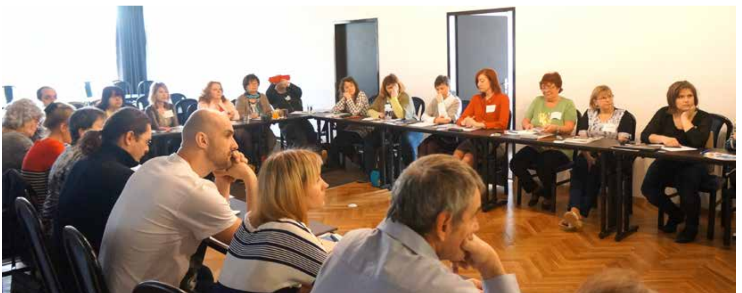
Účastníci vzdelávania EPF v Piešťanoch