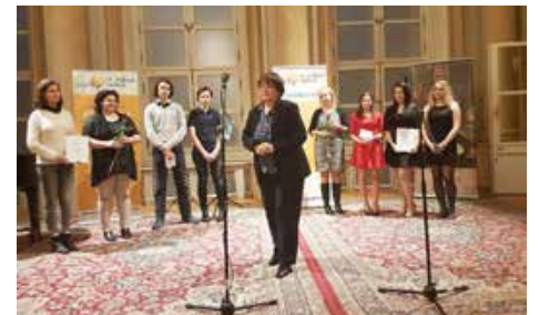
Zľava: Študentom z 1. Súkromného gymnázia na Bajkalskej ulici, Bratislava Zprava: študenti SZŠ, Hlboká cesta, Žilina