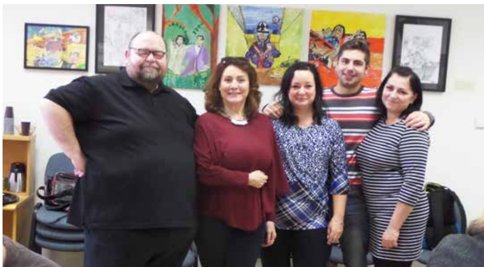
Tím Ligy za duševné zdravie SR