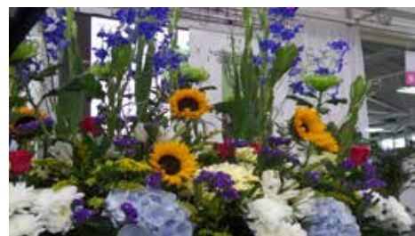
Medzinárodná výstava Flóra 2017

Začiatkom mája za členovia ODOS, ktorí majú záujem o pestovanie a aranžovanie kvetín, zúčastnili medzinárodnej výstavy Flóra v priestoroch výstavniska Incheba v Bratislave. Súťaže v tvorbe kvetinových aranžmánov, organizované v rámci výstavy, boli v roku 2017 tematicky zamerané na 300- ročné výročie narodenia Márie Terézie.