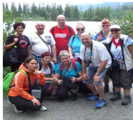
Výlet na Štrbské Pleso

Podrobne sa dočítate o tomto podujatí v druhom čísle časopisu Druhý Breh 2017.