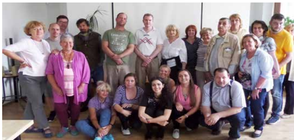
Účastníci Juliálesu v priestoroch LDZ