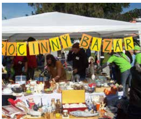
Dobročinný bazár v Považskej Bystrici

Kontaktní rodičia mesta PB prišli s krásnou myšlienkou ako dať veciam druhú šancu. Oslovili obyvateľov mesta a zozbierali veci ktoré viaceré domácnosti už nepotrebovali. Potom ich ponúkli formou dobročinného bazáru na bystrickom jarmoku.