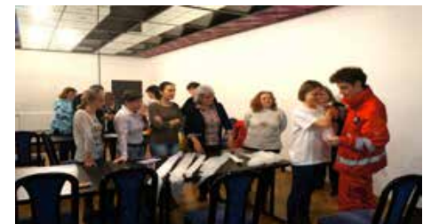
Praktické cvičenie kurzu prvej pomoci

So samotným priebehom prezentácie sa môžete oboznámiť v nasledujúcom článku. Účastníci školenia sa v poobedňajších hodinách rozšli do rôznych miest Slovenska.