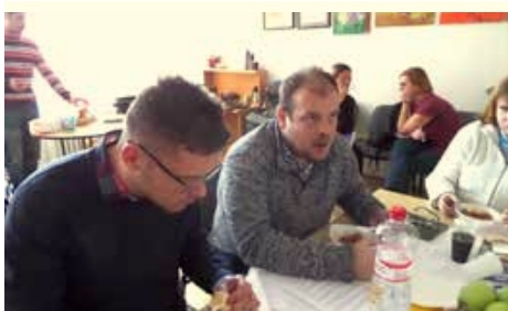
Posedenie pri novoročnej kapustnici