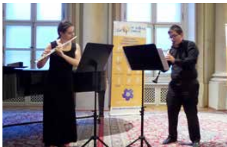
Vystúpenie študentov Bratislavského Konzervatória

Sprievodný program tento rok zabezpečili vystúpenia študentov Bratislavského Konzervatória.