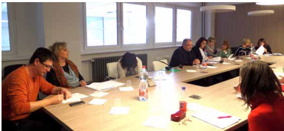
Členovia a hostia zasadania Rady duševného zdravia na Ministerstve zdravotníctva SR

Dňa 12. apríla sa konalo na Ministerstve zdravotníctva SR druhé zasadanie Rady duševného zdravia (RDZ) v roku 2017. Na programe zasadania bolo zhrnutie návrhov zmien a doplnení Národného programu duševného zdravia na obdobie najbližších dvoch rokov.