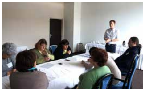
Práca v skupine

nebolo ľahké, ale zvládli sme to so čťou.