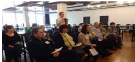
Nácvik organizácie tlačovej konferencie

prezentácia bola na tému Ako fungujú médiá . Doobeda ešte odznela prednáška s názvom Komunikácia s médiami .