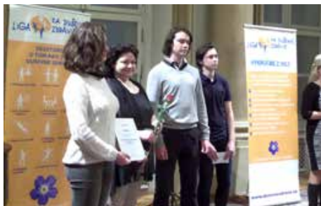
Ocenení študenti – 1. Súkromného gymnázia na Bajkalskej v Bratislave

Súčasťou každoročného oceňovania Ligy za duševné zdravie je odovzdávanie ceny spoločnosti Kaufland – poukážky v hodnote 300 EUR - pre najúspešnejšie školy v celoslovenskej Zbierke Dni nezábudiek . Hodnotia sa školy v Bratislave a osobitne v ostatných mestách Slovenska zapojených do zbierky. V roku 2016 v Bratislave získali najvyšší výnos (1 814,64 EUR) dobrovoľníci –