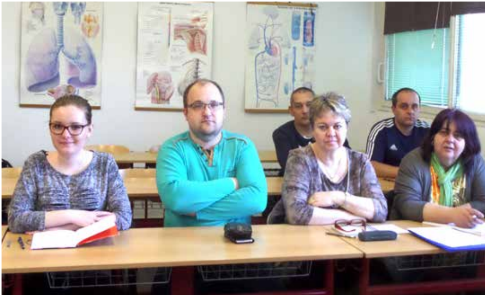
Účastníci vzdelávania kurzu Pacient a liek na SZU - zástupcovia členských združení ODOS z Mozaiky v Žiline a Zdravej duše v Považskej Bystrici

ulici 21 v Bratislave zástupcovia členského združenia Mozaika zo Žiliny, z ktorých väčšina bola v priestoroch ODOS prvýkrát. Mozaikáči sa na druhý deň, spolu s dvoma členmi združenia Zdravá duša z Považskej Bystrice, zúčastnili tematického kurzu kontinuálneho vzdelávania Pacient a liek na Slovenskej zdravotníckej univerzite na bratislavských Kramároch. Bližšie informácie o programe kurzu prinesie samostatný článok.