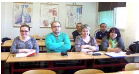
Členovia zo združenia Mozaika v Žiline a Zdravá duša v Považskej Bystrici

V termíne 11. mája 2017 sa konal na Slovenskej zdravotníckej univerzite (SZU) v Bratislave Tematický kurz kontinuálneho vzdelávania pod názvom Pacient a liek . Na toto vzdelávanie sa z našich združení prihlásili 4 zástupcovia občianskeho združenia Mozaika