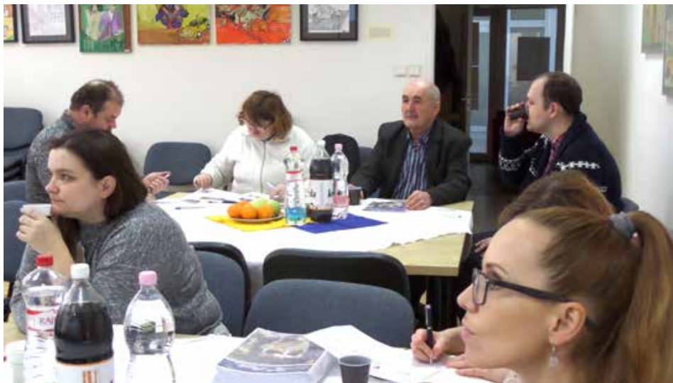
Workshop LDZ – Ako sa zviditeľniť na sociálnych sieťach

Koncom roka 2016 prijali pozvanie Ligy za duševné zdravie zástupcovia členských združení ODOS – ZPP Radosť z Košíc, Sofia, DSS Samaria a DSS-Most z Bratislavy a Šťastie si Ty z Prievidze – na vzdelávací workshop pre lídrov a vedúcich pracovníkov občianskych združení na tému „ Ako sa zviditeľniť na sociálnych sieťach “. Získané poznatky mohli účastníci v budúcnosti aplikovať pri propagácii združenia počas jesennej kampane LDZ a Zbierky Dni nezábudiek.