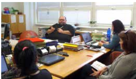
Zasadanie Správnej rady LDZ

v priestoroch Ligy a svoju činnosť realizujú v Bratislave, to znamená, že v budúcnosti nebudú môcť využívať bývalú multifunkčnú miestnosť Ligy na stretávanie sa svojich členov a realizáciu svojich